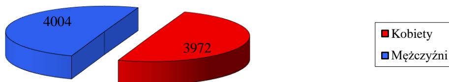
Liczba ludności według płci